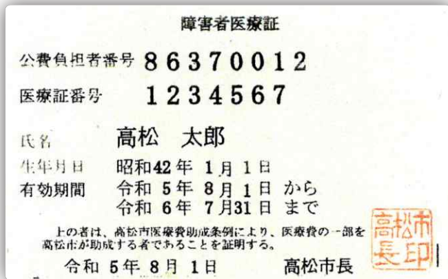
[ 薄い緑 ]